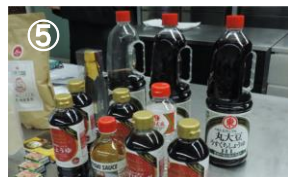
①日本ハラール協会 松井副理事長によるハラールの基礎講座 ②③大阪府日本調理技能士会 室田会長による調理実演 ④ハラール日本料理の調理例(松花堂風に) ⑤ハラール認証商品として入手可能な調味料等の紹介